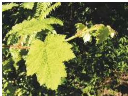
Le Raisin marron