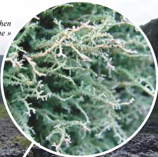
Détail du lichen appelé « fleur de roche »

À ce stade de notre histoire, seuls les lichens et les mousses, dont les « graines » s'appellent des « spores », parviennent à s'installer. Tu en as déjà peut-être vu sur les coulées de lave du Piton de la Fournaise : ces lichens sont de couleur blanche et ne mesurent que quelques millimètres de haut !