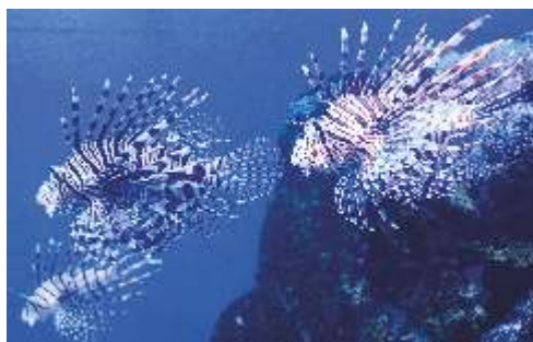
Poisson l'armée (Ptéroïs)

Dans le milieu océanique, l'invasion se retrouve surtout au sein de nos récifs coralliens. Des « Ptéroïs » (un poisson agressif) peuvent décimer tout un récif ! Ils se nourrissent d'autres poissons, et comme certains poissons de récif sont de taille modeste, une seule colonie de Ptéroïs peut parfois manger tous les poissons d'un petit récif corallien ! Lorsqu'il n'y a plus de poissons à manger, ils migrent et vont s'installer près d'un autre récif. En se multipliant très vite, cette EEE met en danger la vie récifale. Elle est en plus venimeuse, aucun poisson n'ose s'en approcher. Si tu en vois lors d'une plongée, éloigne-toi vite de ce poisson : en plus de manger les poissons autour de lui, son venin est mortel pour l'Homme. Sauve qui peut !