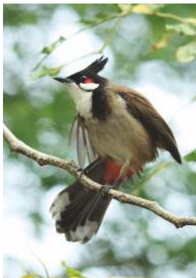
Le Merle Maurice